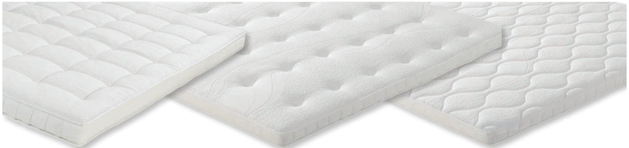
Topper Star Spring (Stretch Pocket mit Naturlatex)