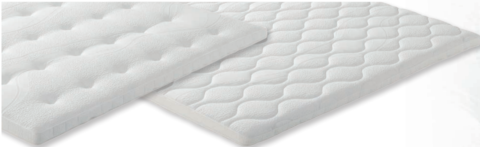
Topper Star Premium (Gel Schaumstoff)