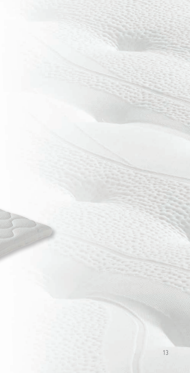
Topper Star Comfort (Latex)